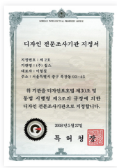
특허청 디자인 전문조사기관 지정서