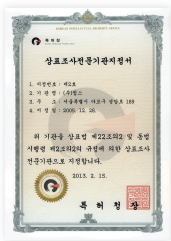
특허청 상표 전문조사기관 지정서

국제보안 정보관리체계 ISO27001과 개인 정보 보호체계 BS10012 인증을 획득하여 고객의 소중한 의뢰정보에 대한 철저한 보안 유지